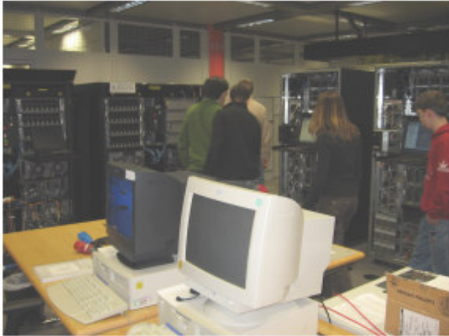
im TIC-Lab (TotalStorage Interoperability Center)