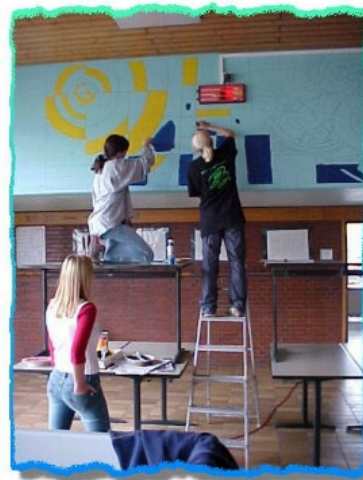
Design-AG gestaltet das Fotovoltaik-Display