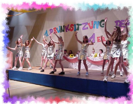
Tanz-AG-Auftritt bei der Prunksitzung

In jedem Schuljahr gibt es – je nach Lehrereinsatz – verschiedene Sport-AGs (z. B. Klettern, Tanz etc.), außerdem AGs im musischen Bereich (Theater, Bigband, Design) oder auch Computer- bzw. Internet AGs. Unser Schülerzeitungs-AG „Penne“ erstellt eine Print- und Online-Version. In besonderen Kursen bereiten wir in Mathematik, Deutsch und Englisch unsere zahlreichen zukünftigen Übergänger auf die gymnasiale Oberstufe vor. Eine aktuelle Liste aller Angebote findet sich immer in unseren Internetseiten.