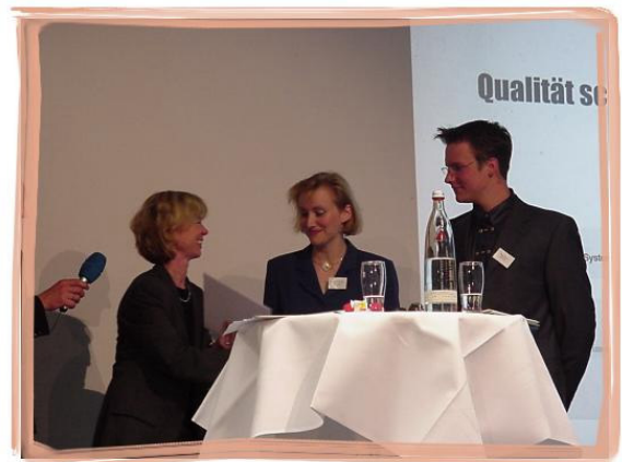
Preisverleihung mit Bildungsministerin

Die Realschule Rockenhausen zeichnet gut beschrittene und neue Wege aus, die für die Schullandschaft in Rheinland-Pfalz - in der Hoffnung auf Nachahmung - Leitbild und Orientierungshilfe sein mögen. (...)