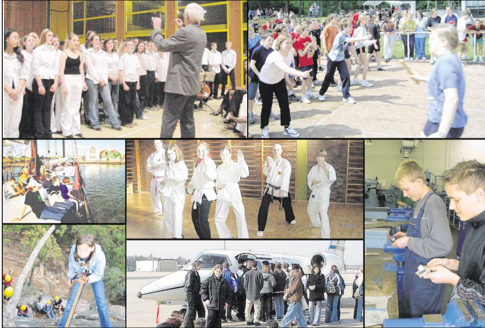
Gehörten und gehören neben dem Lernen zum Jahresprogramm der Realschule Rockenhausen: Sport, Gesang, Berufswelt, Reisen und, und, und...