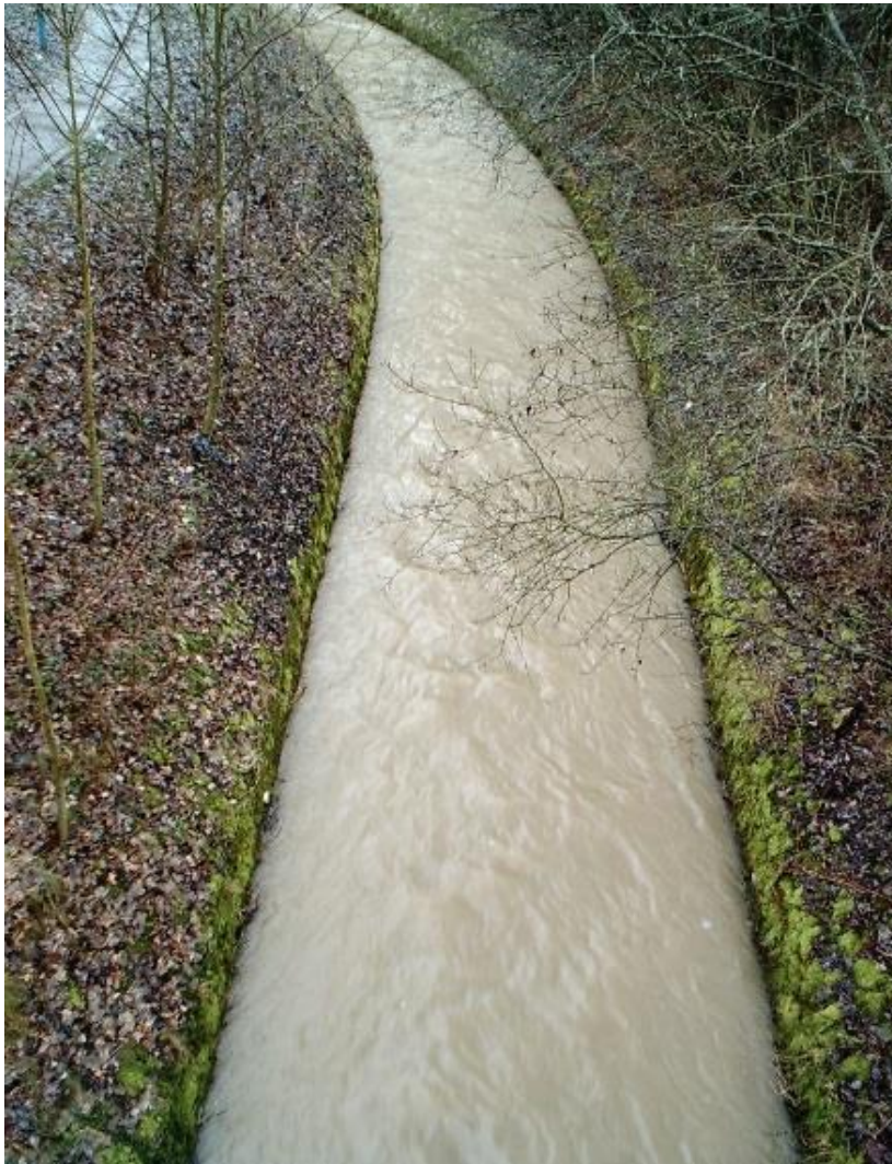
Abb. 1: Wollen wir das wirklich?

Die teilweise extremen Starkregen im Mai und Juni 2016 führten auch in vielen Landesteilen von Rheinland-Pfalz zu großen Schäden, weil kleine Bäche sich in reißende Flüsse verwandelten und Überflutungen ungeahnten Ausmaßes verursachten. Nach jedem Hochwasser werden Schuldige gesucht - und auch schnell gefunden. Die vermeintlich fehlerhafte, weil unterlassene Gewässerunterhaltung wird vielfach für die Ursache der Katastrophe gehalten, denn sie habe dazu geführt, dass die Gewässer verlanden und Totholz verbleibt und dann als Treibgut zu Hochwasserschäden führt.