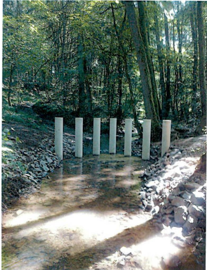
Abb. 5: Treibgutfänger vor einer Ortschaft

3. Vor Eintritt des Gewässers in die Ortslage muss Treibgut und Geschiebe, das in der Bebauung zur Verschärfung der Hochwassersituation führen kann, wirksam zurückgehalten werden.