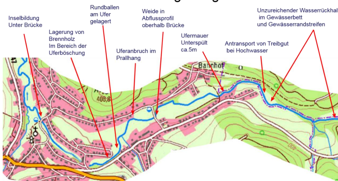
Abb. 7: Problemstellen identifizieren und dokumentieren