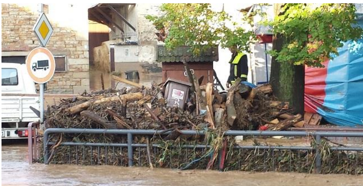
Abb. 2: Treibgut, bestehend aus Wohlstandsmüll, Treibgut und Totholz, an einer „Barrikade“ eines Straßendurchlasses in Waldgrehweiler

Während Überflutungen in den Ortslagen katastrophale Folgen haben können, ist dies im Außenbereich oft nicht so dramatisch. Daher sollte hier jede Möglichkeit genutzt werden, das Wasser in den Auen zurückzuhalten. Naturnahe Gewässer leisten hierzu einen wichtigen Beitrag.