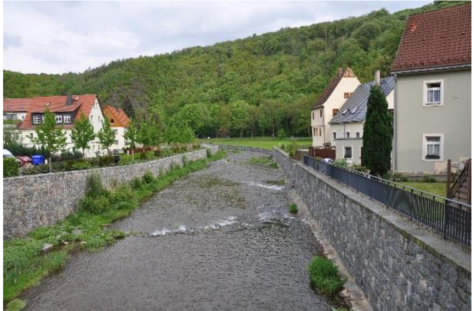
Abb. 3: Bei Hochwasser kann hier viel Wasser durchgeföhrt werden