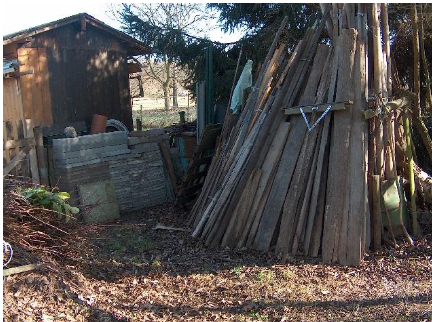
Abb. 6: Lagerung von Holz und anderem Material an den Ufern und im Gewässerrandstreifen – hässlich und bei Hochwasser gefährlich

➤ Treibgut besteht nur zum Teil aus Totholz! Oft ist es eben nicht der Bewuchs im Außenbereich und das im Gewässer mitgeführte Totholz, das die Probleme allein verursacht, vielmehr trägt auch die Lagerung von Material am Gewässer dazu bei. Sie werden bei Hochwasser weggespült, verstopfen die nächste Engstelle und erhöhen in diesem Bereich die Überflutungsgefahr. Insbesondere in der Ortslage sind (illegale) Einbauten am Gewässer (z.B. Stege und Zäune) und die Ablagerung von Holz, Abfällen u. Ä. an den Ufern zu unterbinden. Daher ist es notwendig, die Gewässeranlieger auf ihre Verantwortung sowie mögliche Haftungsfolgen hinzuweisen, für die Freihaltung der Ufer zu